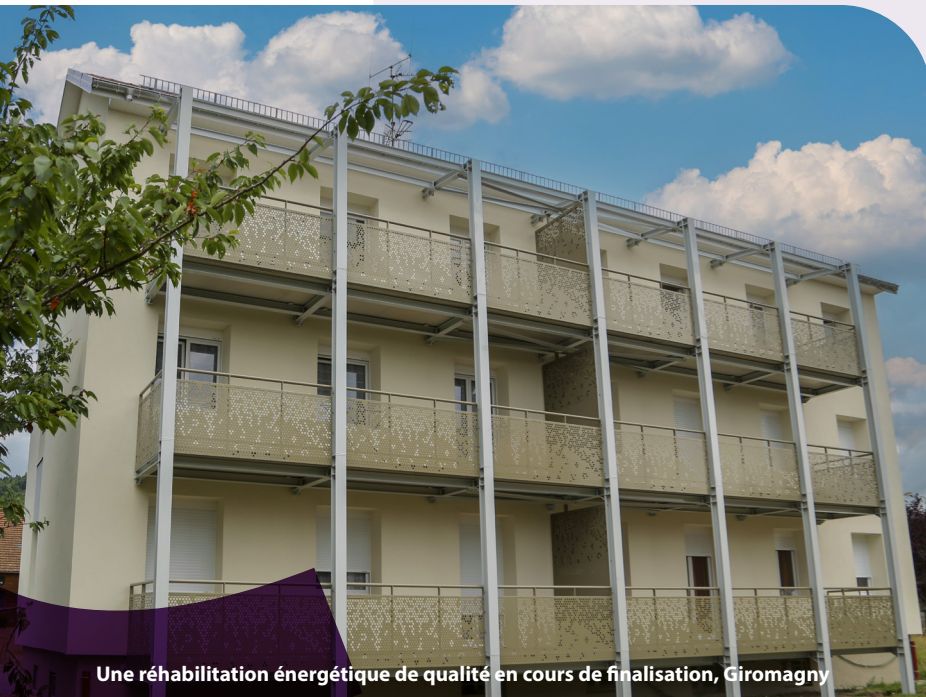
Une réhabilitation énergétique de qualité en cours de finalisation, Giromagny