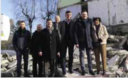
Démolition de 32 logements au 8-14 rue des Frères Berger à Beaucourt le 04 février dernier

Au cours de l'année 2019, plusieurs démolitions importantes se dérouleront. Avant celles des 1 et 2 rue Dorey et du 9 rue Zaporojie à Belfort au mois de juin, nous avons assisté à celle des 32 logements des 8 à 14 rue des Frères Berger à Beaucourt. Elles s'inscrivent dans un projet global s'étalant sur plusieurs années et comportant le grand tryptique de notre mission : démolitions, réhabilitations, constructions.