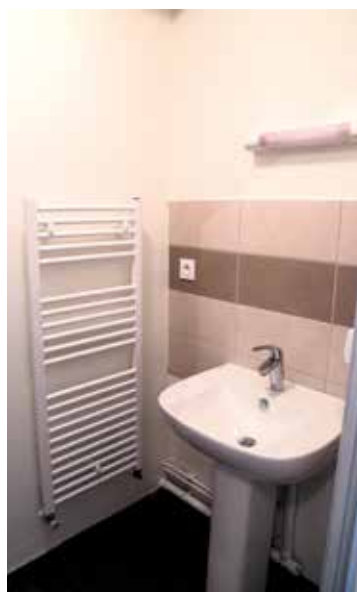
Aménagements de cuisines / salles de bain